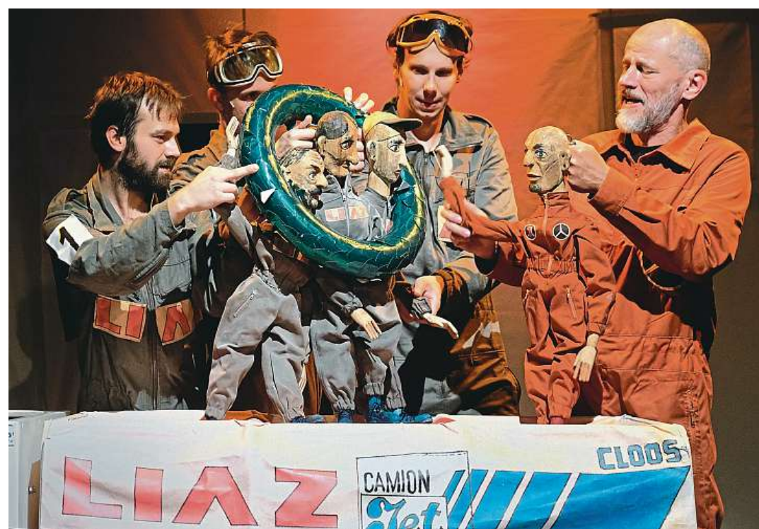
Pohádka o Liazce. Inscenace se inspirovuje úspěchy kamionu LIAZ při rallye Paříž-Dakar.

Příběh vypráví o montérech a závodnících, zvyklých doposud leda tak rozvážet sudy vtravslavického piva po libereckém okrese. Právě před nimi vyvine jednoho dne ne-